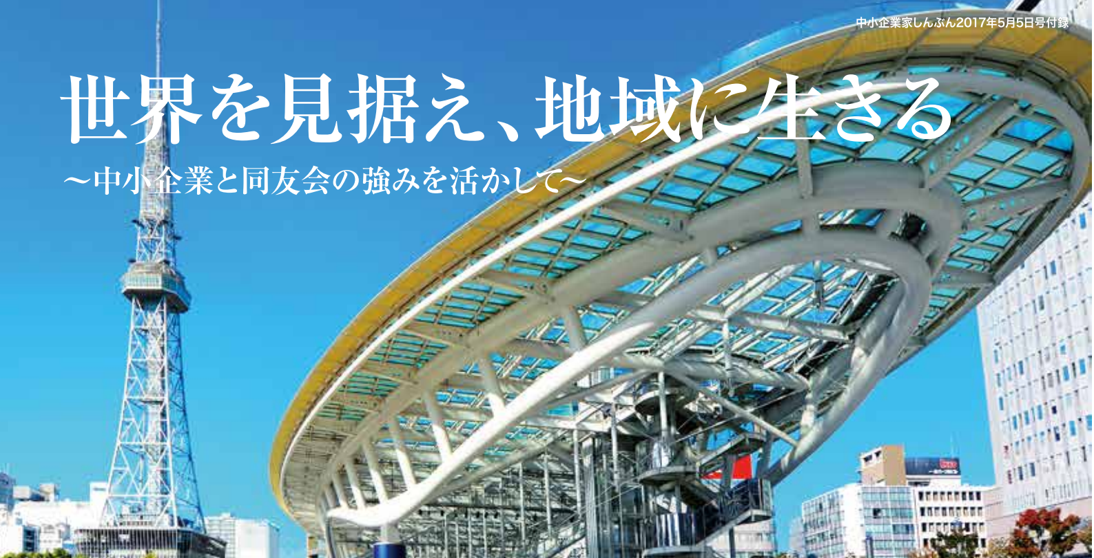
「栄・オアシス21」からテレビ塔を望む