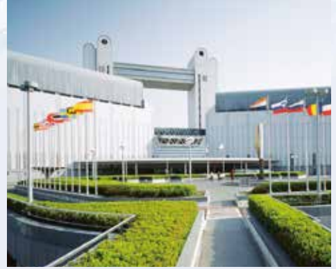
名古屋国際会議場